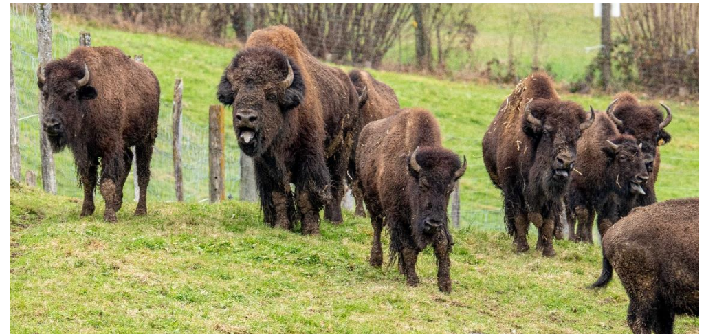
Ausgewehrte Herde nach einem 15-minütigen Sprint über die Weide.